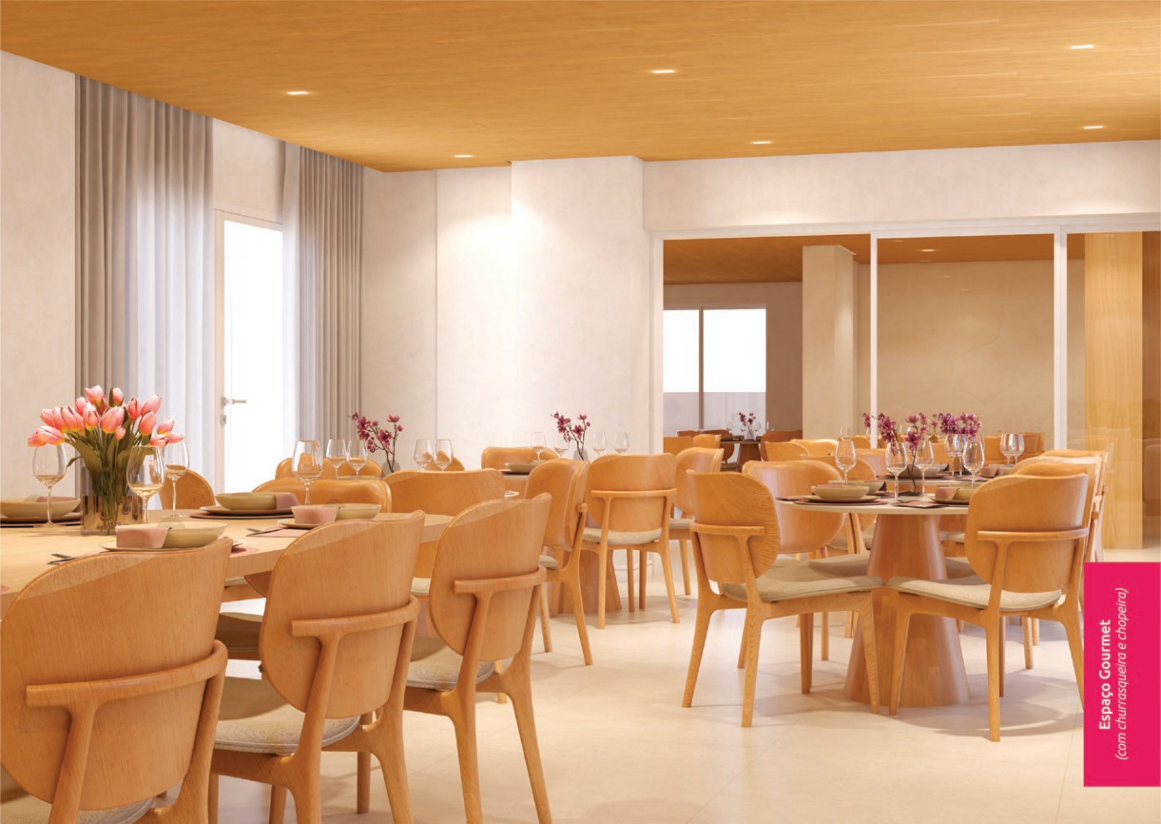
Espaço Gourmet (com churrasqueira e chopeira)